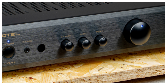
面板采用拉丝工艺，左侧带有3.5mm耳机插孔，用于调节低音、高音和平衡的旋钮

A10 MKII采用了Rotel自制的大型环形电源变压器，电量充沛，提供纯净和稳定的线性电源输出。搭载AB类功放，在转换效率与保真度之间取得不错的平衡，提供负载8欧姆的情况下，可以稳定输出达