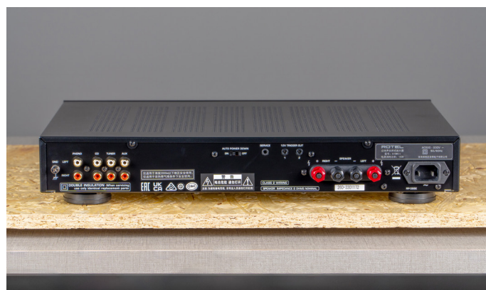
4组RCA输入，其中一组内置了MM唱头放大器，并且配置了12V触发接口

到50W的功率。足以驱动大多数的书架音箱，应对日常听音乐需求完全绰绰有余，配合一些灵敏度高的音箱，能够获得更高的输出表现。